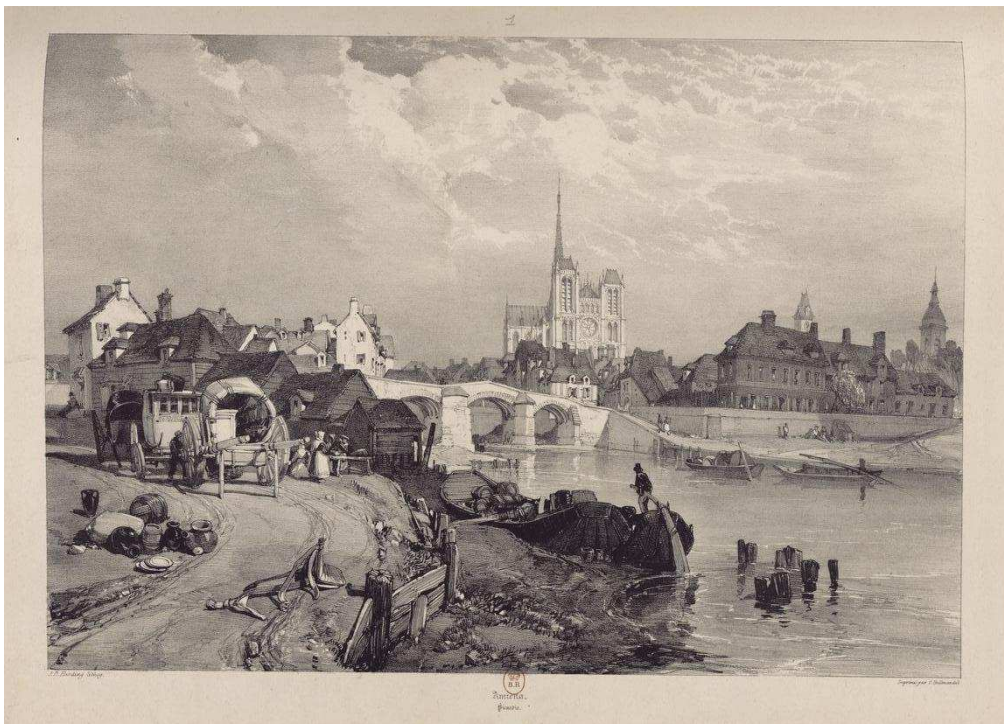
Conception et réalisation d'un dispositif cartographique multimédia de l'exposition « La fabrique du Romantisme, Charles Nodier et les voyages pittoresques »