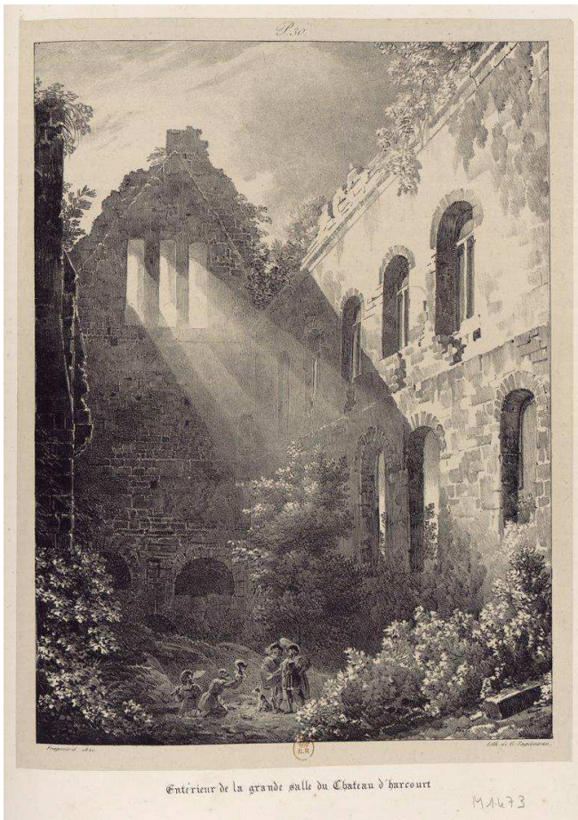
« Intérieur de la grande salle du Château d'Harcourt » – vol. p. 165 (Région Normandie)