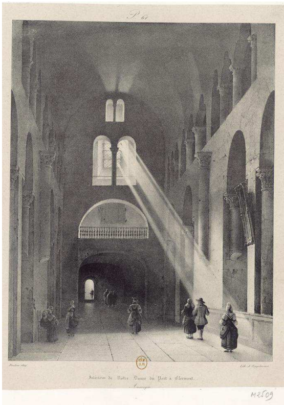
« Intérieur de Notre-Dame du Port à Clermont » vol.1 p.185 (Région Auvergne)

Conception et réalisation d'un dispositif cartographique multimédia de l'exposition « La fabrique du Romantisme, Charles Nodier et les voyages pittoresques »