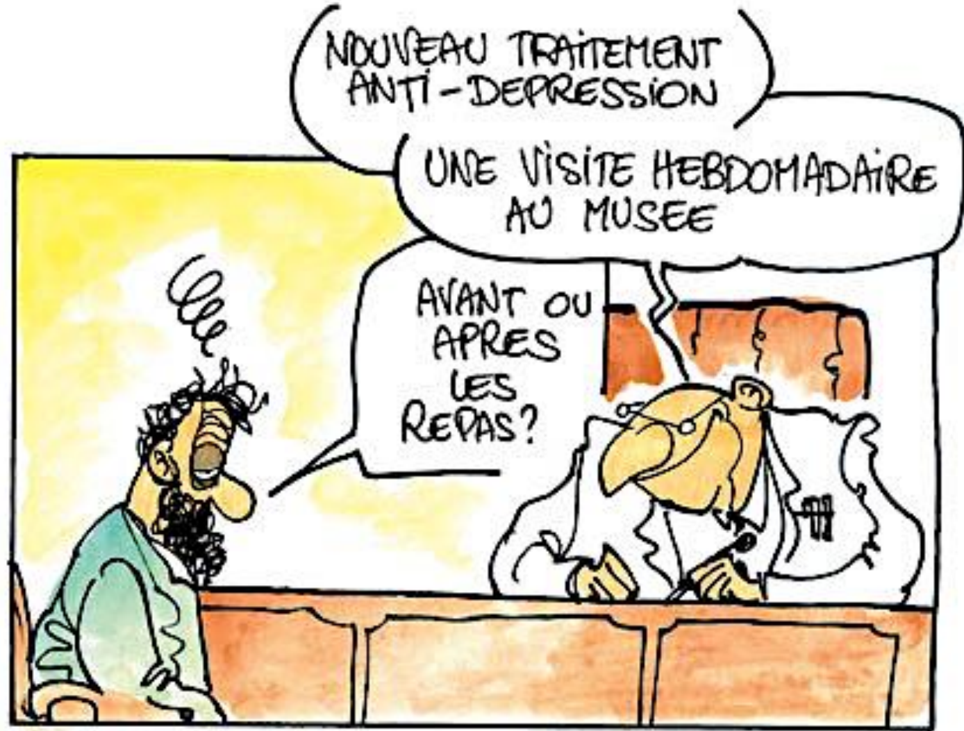
Illustration pour Ludovic Hirtzmann, « Montréal. Les médecins envoient leurs malades au musée », Le Télégramme , 31 octobre 2018

Profitez d'une visite gratuite au Musée pour vous faire du bien!