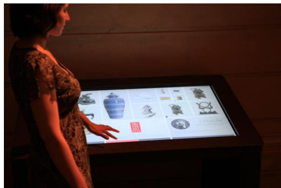
Table multitouch d'accueil