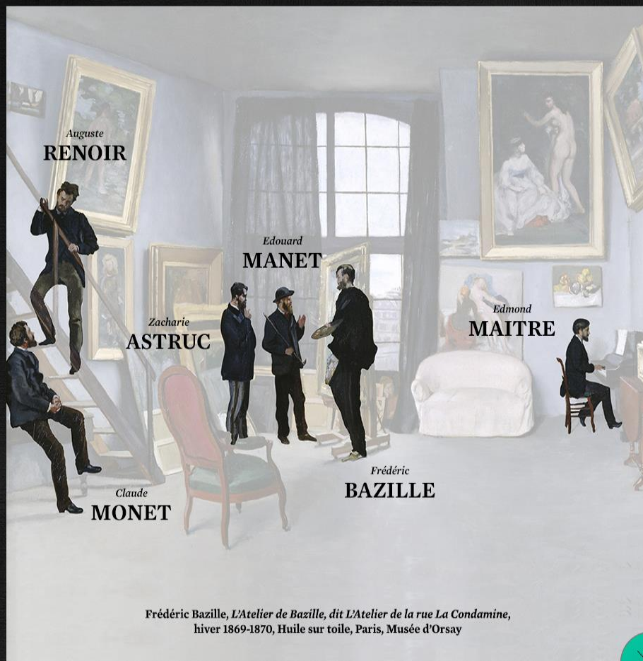
Frédéric Bazille, L'Atelier de Bazille, dit L'Atelier de la rue La Condamine , hiver 1869-1870, Huile sur toile, Paris, Musée d'Orsay