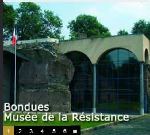
Bondues Musée de la Résistance