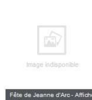
Fête de Jeanne d'Arc - Affiche