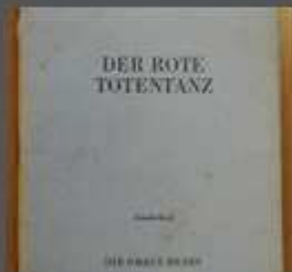
Die Graue Reihe - Revue