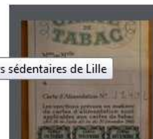
Carte de rationnement