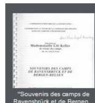
"Souvenirs des camps de Ravensbrück et de Bergen..."