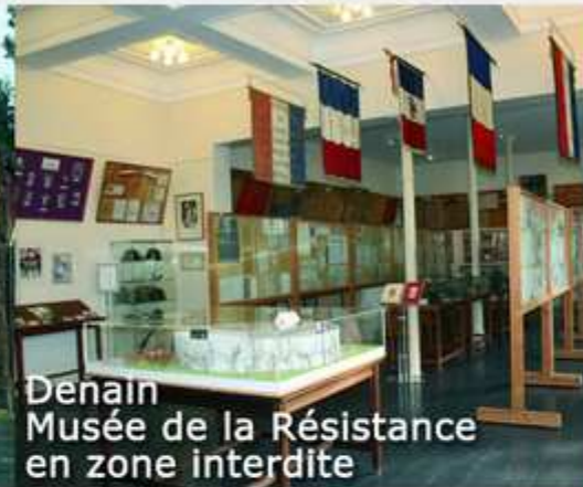
Denain Musée de la Résistance en zone interdite