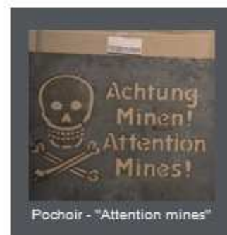
Pochoir - "Attention mines"