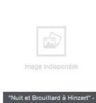
"Nuit et Brouillard à Hinzert" - Livret