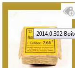
Boîte de cartouches