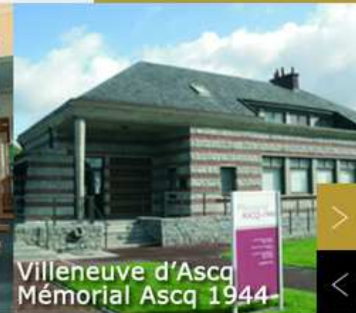
Villeneuve d'Ascq Mémorial Ascq 1944