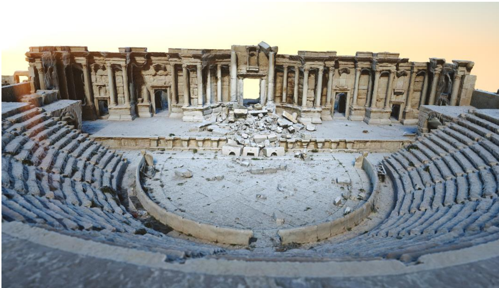
Reconstitution 3D du théâtre de Palmyre, Syrie