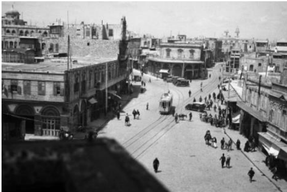
Michel Ecochard, Bab Al-Faraj, Alep, Syrie, 1937