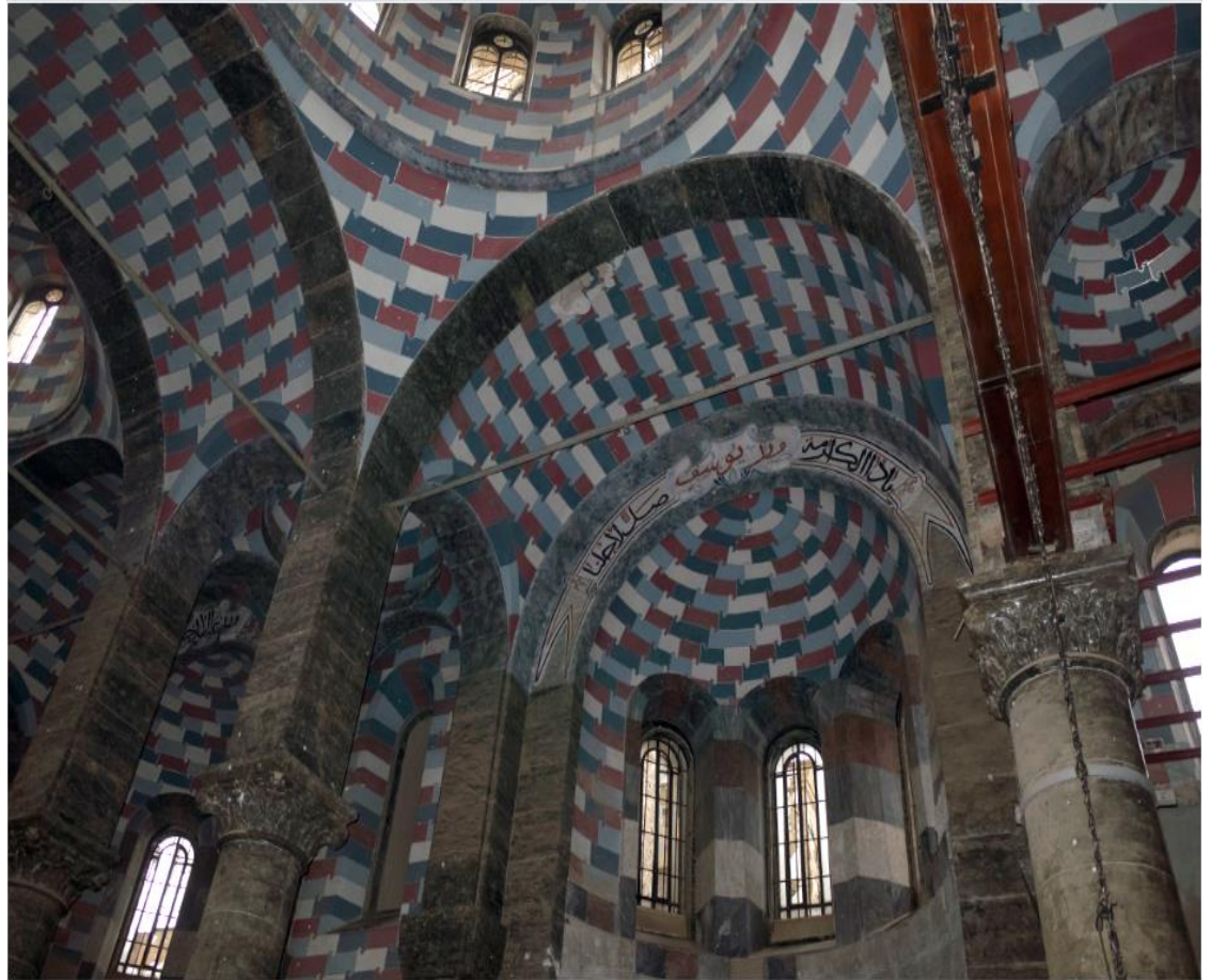
Intérieur de l'église Notre-Dame de l'Heure, Mossoul, Irak, février 2018