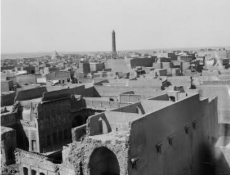
G. Eric and Edith Matson, Vue de Mossoul avec la mosquée al-Nouri, Irak, 1932